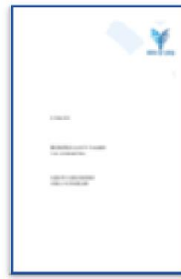
Bilirkişilik Kanun Tasarısı Hakkında Görüş ve Öneriler