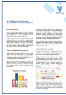
Uyuşmazlık Çözüm Zihniyetini Değiştirmek için Tam ve Doğru İfşa ve İbraz