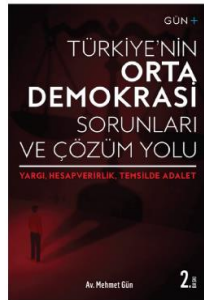
Türkiye'nin Orta Demokrasi Sorunları ve Çözüm Yolu