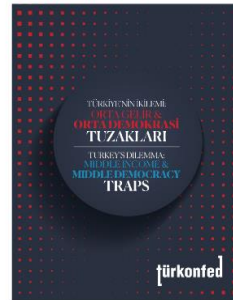
Türkiye'nin İkilemi: Orta Gelir ve Orta Demokrasi Tuzakları