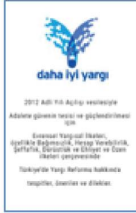
Yargıda İyileştirmeye Yönelik Tespit ve Öneriler