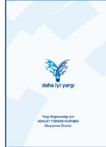
Yargı Bağımsızlığı için Adalet Yüksek Kurumu