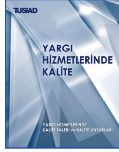
Yargı Hizmetlerinde Kalite ve Kalite Unsurları